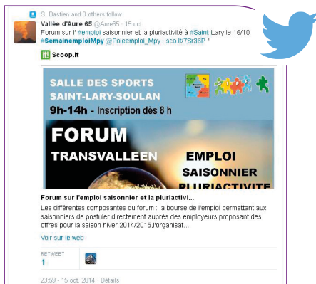
Twitter en 2015

Pôle emploi est présent sur ce réseau social incontournable, sur lequel nous adressons principalement à tous les acteurs de l'emploi et de la formation, les médias, les entreprises... Ceci va nous permettre d'annoncer et de suivre les différents événements et actions de cette Semaine de l'emploi, et ceux qui le souhaitent pourront recommander l'évènement.