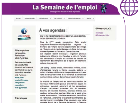
Le site en 2016

Ce site dédié spécifiquement à la Semaine de l'emploi, permet à toute personne intéressée, d'avoir en quelques "clics" toutes les informations pratiques sur l'ensemble des événements organisés dans toute la région Midi-Pyrénées. Il est également précisé si la participation nécessite une inscription au préalable.