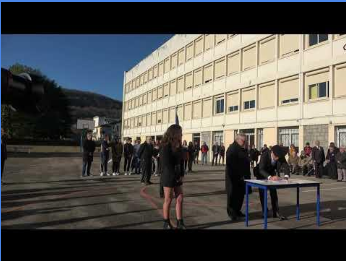
Ci-dessus, la cérémonie de remise du drapeau à nos prédécesseurs dans la CDSG.