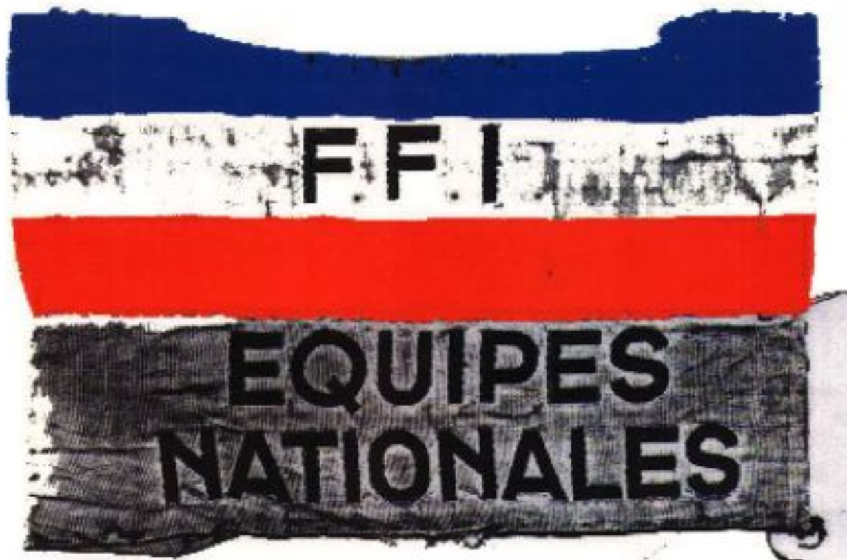
Brassard porté par les Equipiers Nationaux à l'Hôtel de Ville